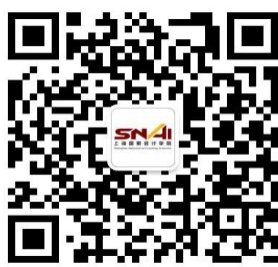
微信：上海国家会计学院

为方便您备考咨询，您可关注 官网 ： master.snai.edu ， 电话 ：021-69768051，及 邮箱 ： mpacc@snai.edu ，或通过以下渠道获取在读生备考经验。此外，登录 映客 APP ，搜索 映客号 ： 118331046（SNAI 研招办） ，也可回看校园开放日等活动直播视频，或是参与下次直播互动，直接了解一手信息。