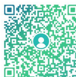
百度贴吧：上海国家会计学院研究生部吧