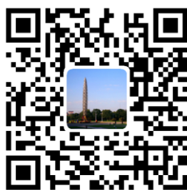
微博：上海国家会计学院研究生部