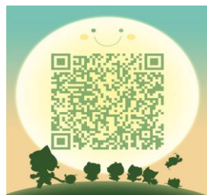
上国会考研交流群 扫一扫二维码，加入该群。