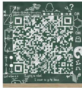
上国会非全日制考研群 扫一扫二维码，加入该群。