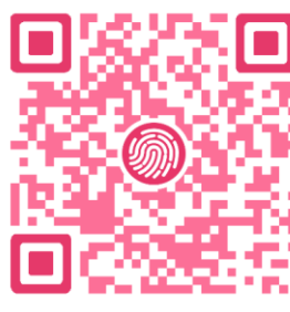
考研论坛上海国家会计学院专版